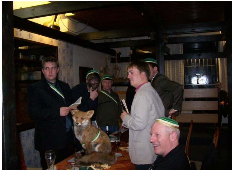
... und danach!

Dieser Kneipabend war wieder eine gelungene Veranstaltung und es zeigte sich, dass „Jung und Alt“ hervorragend zusammen passen und genussvolles Feiern nicht altersabhängig ist!