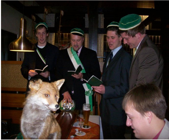
Der Fuxenstall beim Intonieren der „halben Weise voraus“ (noch vor der Aktivierung der neuen Füxe!)